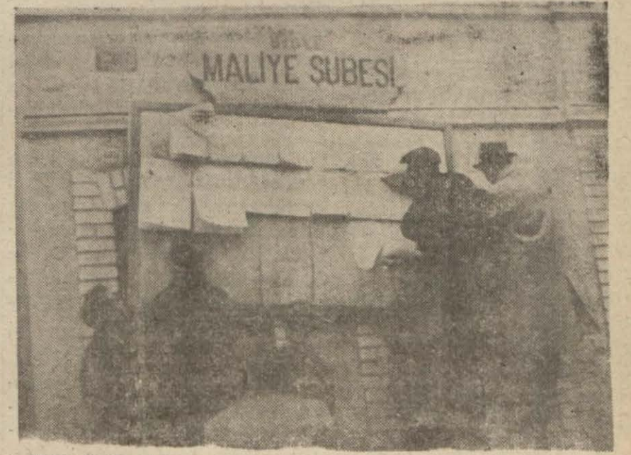
Mükellefler bir şube onunde listeleri gözden geçirirlerken

Cuma günü öğrenmiş olan birçok mükellefler dün sabahtan itibaren vergilerini vermeğe başlamışlardır. Bu erada Millî Reasii