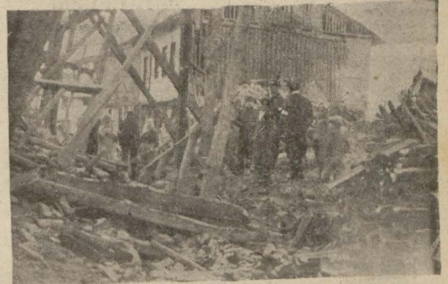
Erbaada bundan evvelki zezeteye aid bir görünüş

Ankara, 22 (A.A.) — 20 Kânunuevvel saat 17 de Tokad vilâyeti mmtakasında ve bilhassa Erbaa ve Niksarda bir yer sarsıntısı olduğu ve daha ziyade Erbaanın bu sarsıntıdan fevkalâde müteessir olarak büyük hasar ve insan kaybı vukubulduğu gelen haberlerden anlaşılmıştır. Vali Derakap hastane operatörünü alarak Niksar üzerinden Erbaaya gitmiştir.