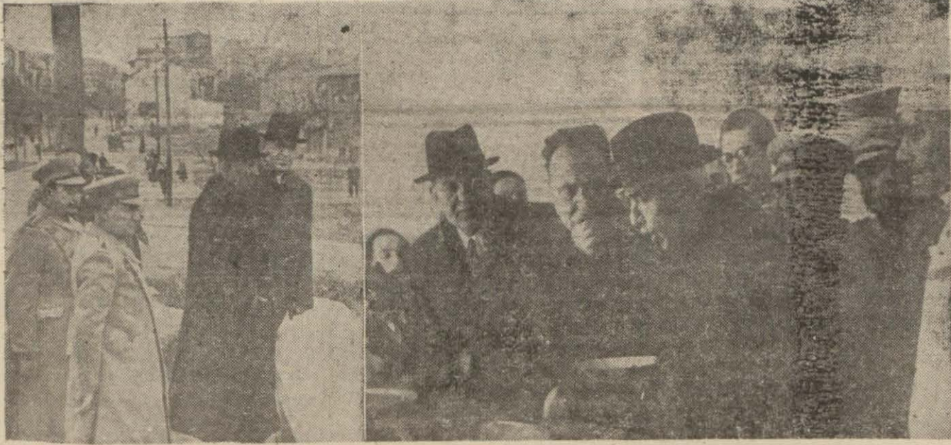
Millî Şef Karagömrükteki stadyum sahasını tetkik eder ve bir aşevinde pişirtirden yemekün radına bakarlar

İsmet İnönü Kızılayın aşevlerini gezdiler, yemekleri tetkik ettiler ve izahat aldılar